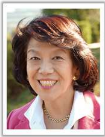
衆議院議員あべともこプロフィール

また、待機児童問題の解決にはなりません。消費税増税で更に格差が広がると批判が起きています