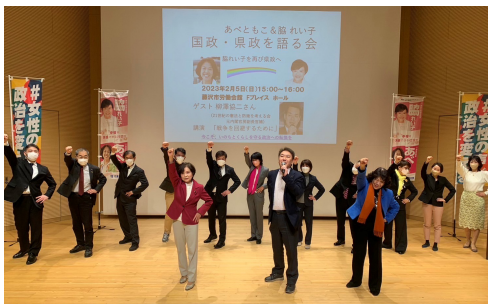
集会にて、皆で「ガンバロー！」