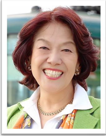
衆議院議員あべともこプロフィール

今春の統一選に向けて、平和といのちを大切に足元からの政策実現にむけて活動する脇県議とその仲間たちにぜひご注目ください。